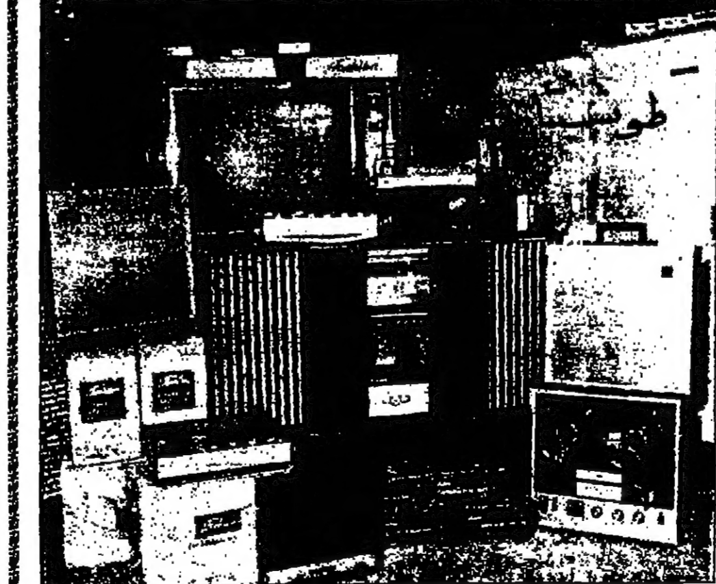
يسر وكالة طوشيا العالمية ان تعلن من وصول جوائز ياتصبغ طوشيا الجاني الكبير الذي جرى بواسطة اذاعة الملكة الأردنية الهاشمية وهي معروضة الآن في احد معارضها ( معرض الصفاي ) بشارع بيسان على الفائزين التكرم بالحضور شخصيا يوم الخميس الموافق ٢٠-١١-١٩٦٨ لاستلام جوائزهم .